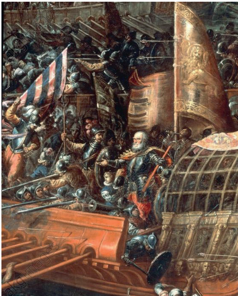
A sinistra: Sebastiano Venier (1496-1578) Capitano Generale da Mar e futuro Doge di Venezia, affronta intrepido il Turco alla battaglia di Lepanto. Accanto a lui, il gonfalone di San Marco. Particolare da un dipinto di Andrea Vicentino del 1603. Venezia. Palazzo Ducale.