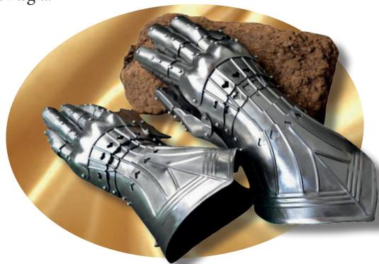
In basso: Luglio del 1571. La flotta della Lega Santa si concentra a Messina, prima di affrontare quella musulmana a Lepanto. Le tre figure femminili rappresentano la Spagna, la Chiesa e Venezia alleate. Affresco del 1572 di Giorgio Vasari. Città del Vaticano. Sala Regia.